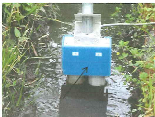
下限フロートを下げることで約 3cm の水位間となります。