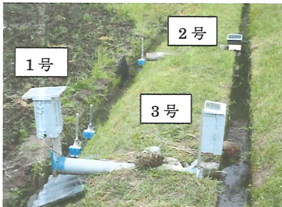
(パイプ径により変換アダプターあり)