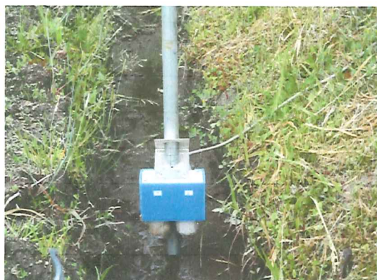
初期では水位間は約 1 cm。